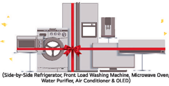
(Side-by-Side Refrigerator, Front Load Washing Machine, Microwave Oven, Water Purifier, Air Conditioner & OLED)